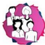
Module 2: Efficiency coping with bullying in school: A practical approach for teachers