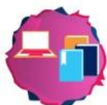
Material for Thematic School Days/Weeks

După cum furnizează materiale didactice și de învățare pentru clase individuale,