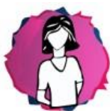
Module 1: Combat Bullying – Guidelines and Tools for school leaders