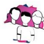
Module 3: Anti-Bullying Tools and Resources for Parents: Protect Your Children and Support Safe Schools