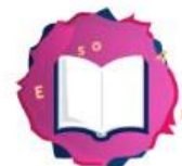
Reading Against Bullying

construirea relațiilor cu colegii de clasă managementul conflictelor și dilemelor din școală, înțelegerea diferitelor culturi și alte teme relevante pentru problematica bullying-ului. Aceste profiluri de cărți includ și un scurt rezumat al cărții și explică de ce cartea este relevantă pentru bullying-ul școlar.