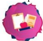
In-Class Activities/Lesson Plans

Toolkit-ul ComBuS include planuri de lecție și activități care să se realizeze cu elevii la clasă. Aceste activități urmează o abordare inter-tematică, și sunt destinate a fi utilizate de către profesori în planificarea activităților anti-bullying pe care le